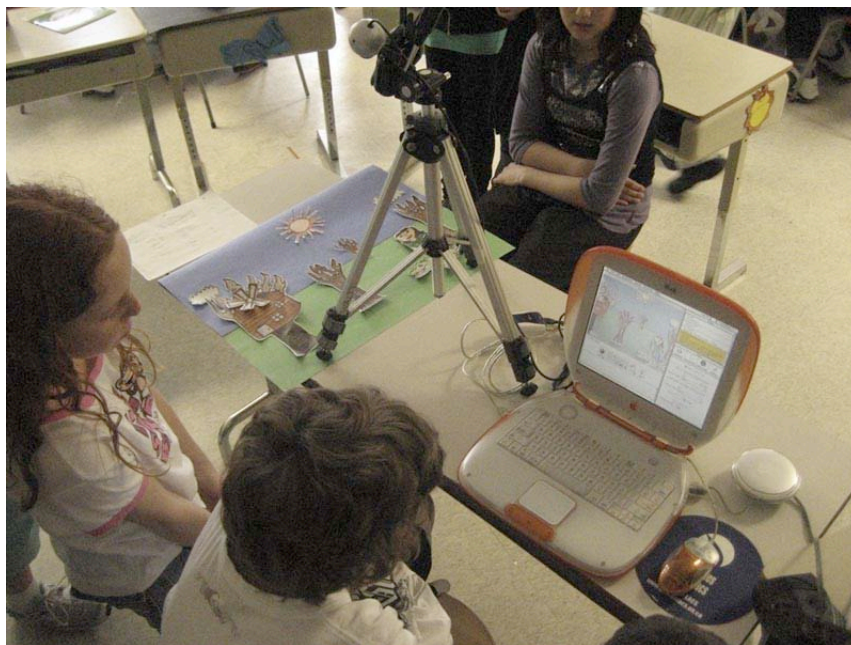
Les élèves en pleine tournage à l'Ecole Jeanne Sauvé • Sudbury